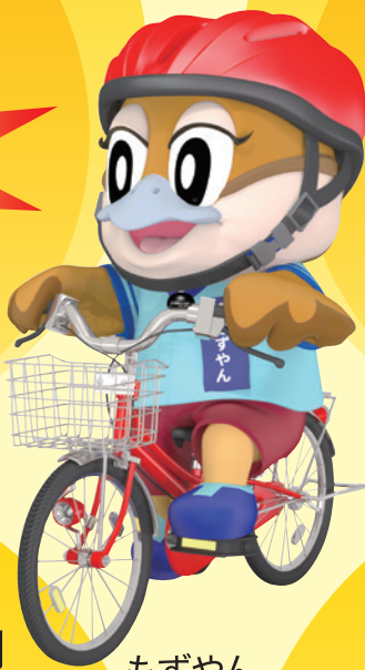
もずやん 大阪府広報担当 副知事